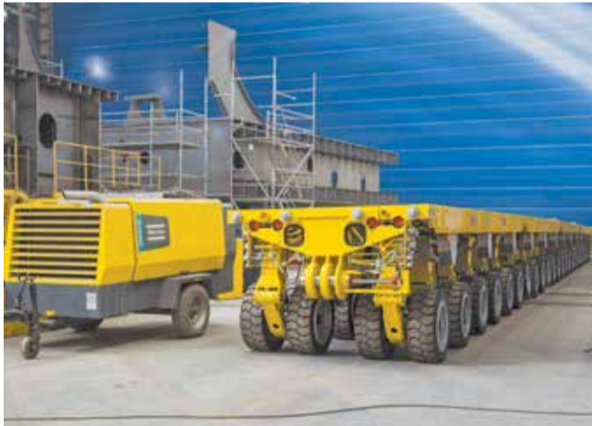
Колёсные транспортёры предназначены для перемещения крупногабаритных секций и блоков судов между цехами и площадками верфи

Помимо уникальной грузоподъёмности оборудование обладает повышенной манёвренностью, а именно семью режимами движения – как на месте с полным грузом, так и в процессе транспортировки груза путём смены рулевых программ. Также транспортёр способен преодолевать разноуклонные препятствия с уклоном при полной нагрузке не менее 6%: благодаря автоматическому позиционированию рабочей платформы в горизонте – при передвижении по неровной поверхности, через препятствия типа рельсов – и гидравлической компенсации нагрузки на оси для равномерного распределения нагрузки от груза на грунт. Угол поворота каждой оси колеса также нестандартен – от 0 до 130 градусов в режиме диагонального и диагонально-поперечного хода, что позволяет транспортёру максимально маневрировать в сложных и тесных усло-