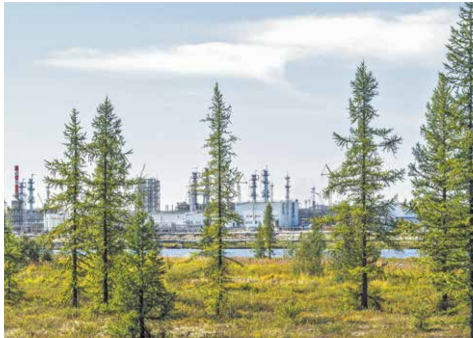
Суммарно за последние три года Компания высадила свыше 3,5 млн саженцев

Всего в высадке саженцев в 2020 году приняли участие более 60