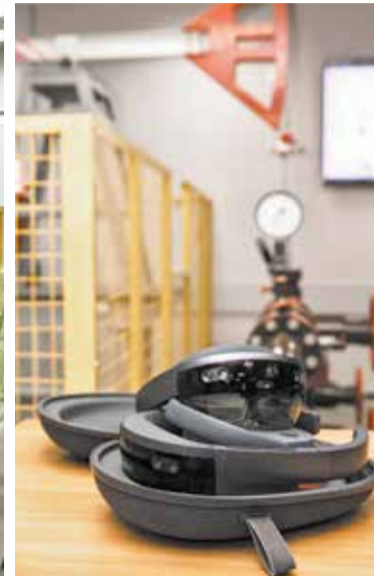
Технология дополненной реальности открывает новые возможности в обучении производственного персонала

статистику по выполнению заданий в режиме реального времени и проводить индивидуальную корректировку обучающих программ на основе статистики наиболее часто совершаемых ошибок. В дальнейшем планируется существенно расширить количество обучающих интерактивных курсов с использо-