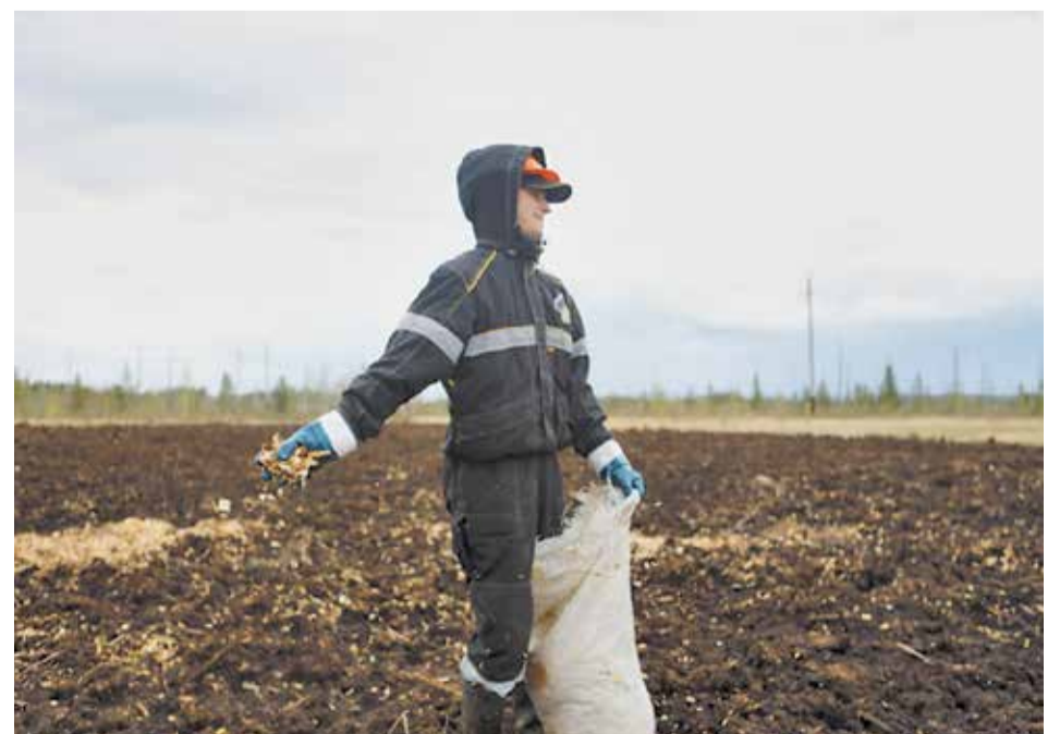
За последние три года площадь загрязнённых земель на лицензионных участках ООО «РН-Юганскнефтегаз» снизилась более чем на 20%

Для реализации комплексного подхода используется самая современная техника: экскаваторы-амфибии, крупнотоннажные вездеходы, плавающие болотоходы, снегоходы, мини-вездеходы.