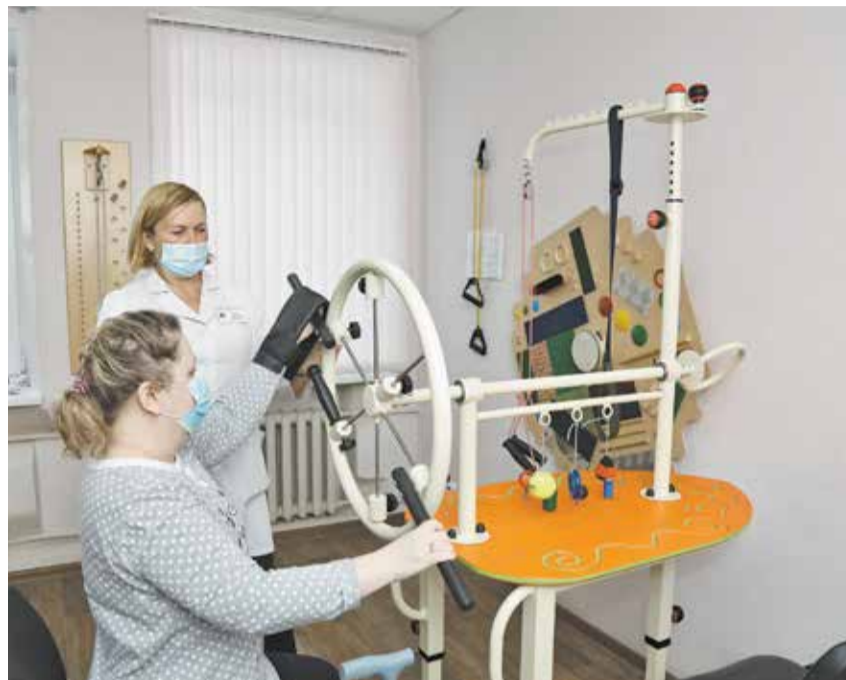
На средства Компании приобретены физиотерапевтическое оборудование и тренажёры для реабилитации

компьютеры для обучения компьютерной грамотности людей старшего возраста и людей с ограниченными возможностями. В актовом зале установлены экран, ноутбук и проектор с колонками: теперь здесь проводятся вечера кинотерапии, беседы и лекции, поэтические гостиные и онлайн-экскурсии.