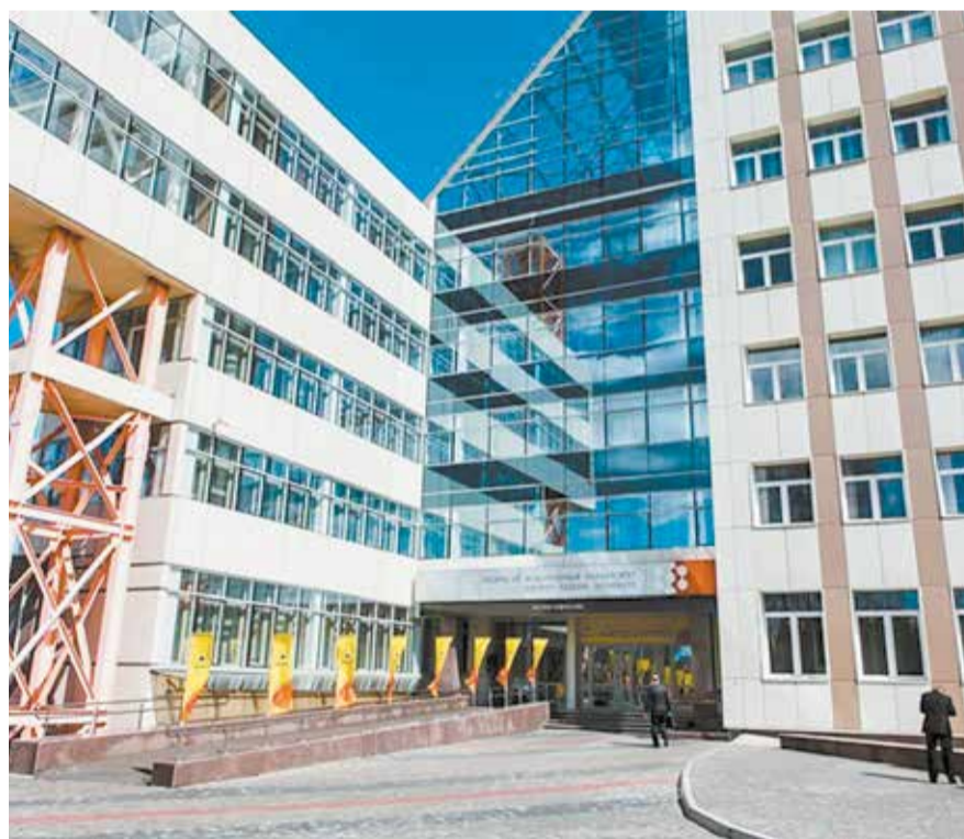
Сибирский федеральный университет является партнёром Роснефти по довузовской подготовке учащихся в «Роснефть-классах»

Проект рассчитан на три учебных года. Занятия по специально разработанным модулям будут проводить работники «Славнефть-Красноярскнефтегаза». Программа проекта предусматривает экскурсии на производственные объекты, общение с сотрудниками, участие студентов в различных профориентационных мероприятиях, тематических семинарах и тренингах. Обязательными условиями являются научно-исследовательская деятельность, прохождение практики и успешные результаты ежегодного тестирования. По окончании проекта лучшие студенты получают преимущество при трудоустройстве в «Славнефть-Красноярскнефтегаз».