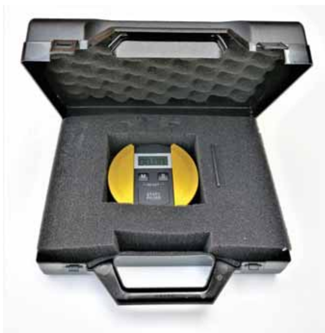
Система ТРИО. CPS в кейсе

Система ТРИО.CPS – предназначена для контроля горизонтальных поверхностей на микробиологическую загрязненность в чистых комнатах в соответствии с ISO 18593