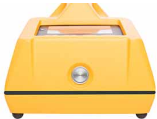
Разъем для подключения подзарядного устройства