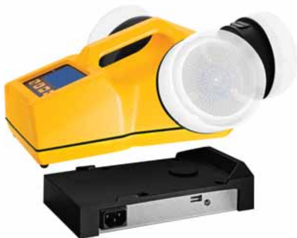
Модель ТРИО БАС ТРИО с проводной подзарядкой