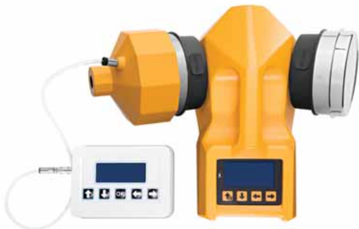
Система КАЛИТЕСТ на ТРИО БАС ДУО