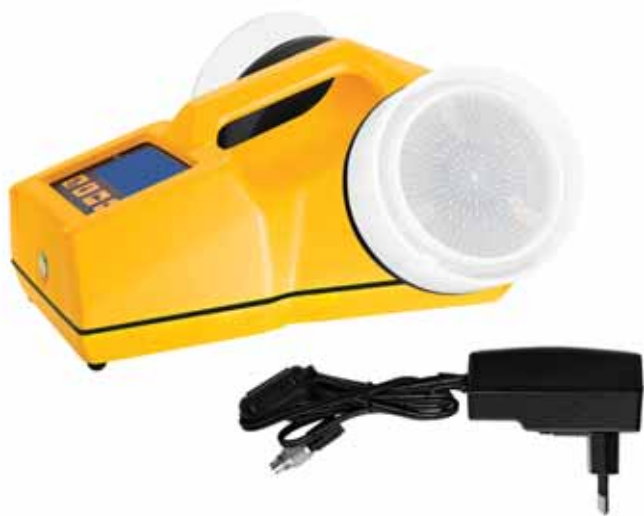
Модель ТРИО БАС ДУО с проводной подзарядкой

Рекомендуется для организаций, которые осуществляют большое количество отбора проб на разные питательные среды или с контрольной чашкой Петри.