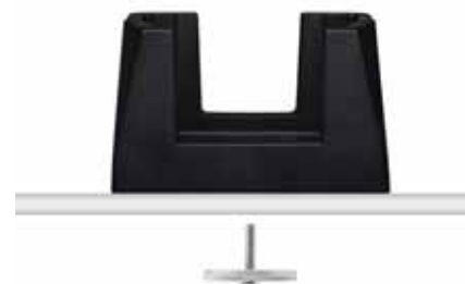
Держатель для вертикального размещения. Противоударный полимер. Размер: 15 x 11 x 9 см. Вес 400 гр.