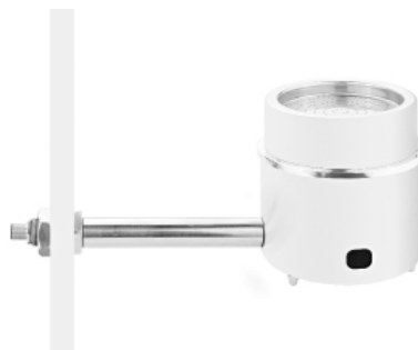
Установка САТЕЛЛИТА на кронштейне