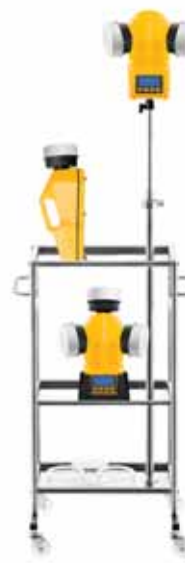
Специальный многоуровневый стэнд. Модель МАКСИ