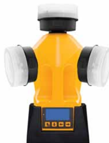
Модель ТРИО БАС ДУО с индукционной подзарядкой