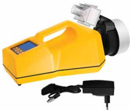
Модель ТРИО БАС МОНО с фильтром HEPA