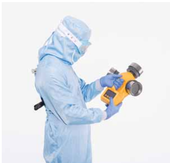
Установка головки на модель ТРИО БАС ТРИО Установка программы