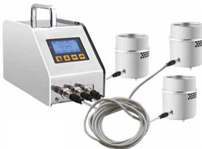
ТРИО БАС РАБС ИЗОЛЯТОР с тремя САТЕЛЛИТАМИ