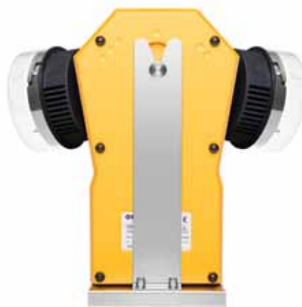
Модель ТРИО БАС ДУО с подставкой из нержавеющей стали