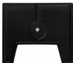
Держатель для вертикального размещения. Противоударный полимер. Размер: 14 x 12 x 1 см. Вес 100 гр.