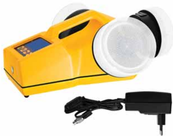
Модель ТРИО БАС ТРИО с проводной подзарядкой