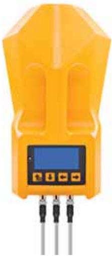
Корпус ТРИО БАС МУЛЬТИСТЕЙШН