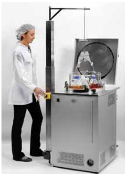
Лебедка FOBOS для автоклавов объемом 50, 80 и 150 литров