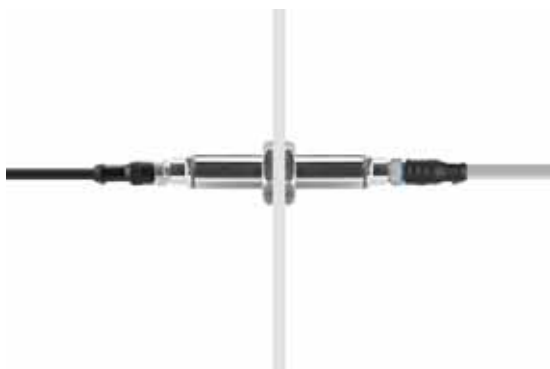
Специальный электрический переходник в стене