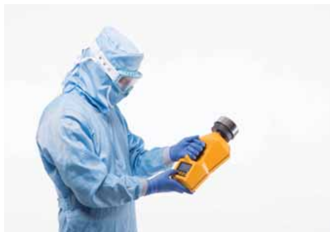
Выбор объема прокачиваемого воздуха