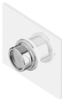
Установка САТЕЛЛИТА в стене

Эргономичный дизайн, сбалансированная конструкция и малый вес. Антибактериальный ударопрочный корпус из технического полимера.