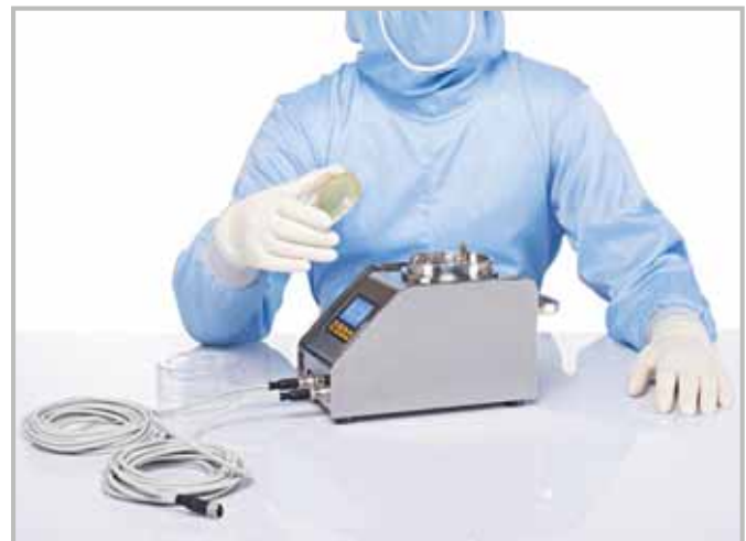
Легкая работа с блоком