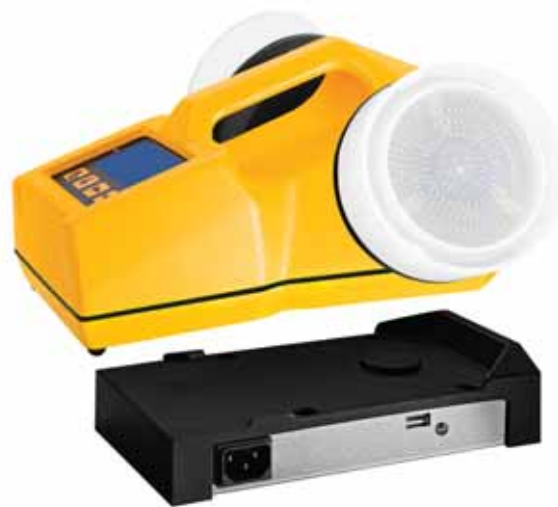
Модель ТРИО БАС ДУО с индукционной подзарядкой