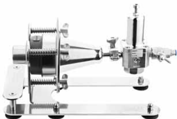
АДАПТЕР ТРИО ГАЗ