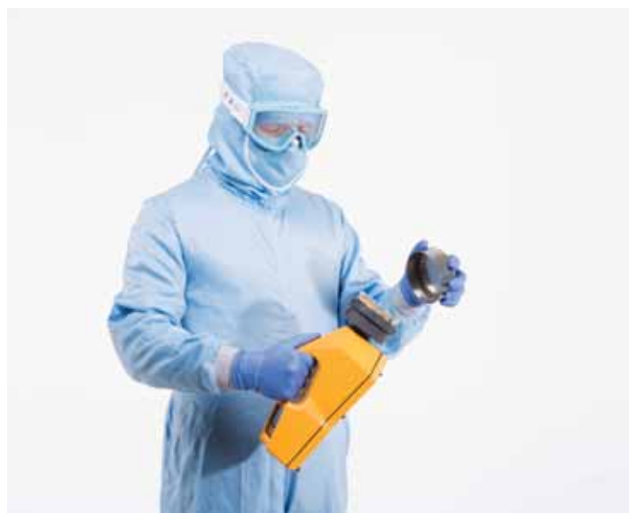
Установка головки на модель ТРИО БАС МОНО