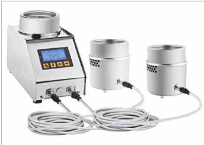
Подключение к 2 САТЕЛЛИТАМ