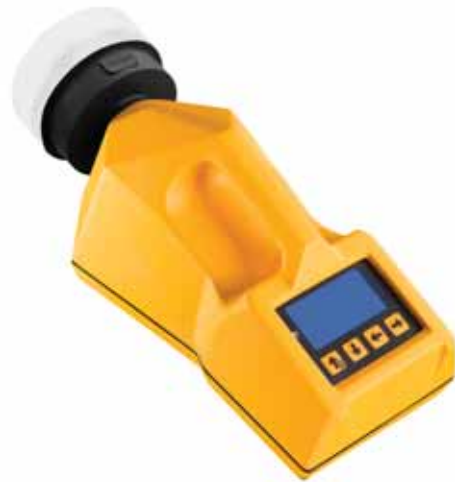
Модель ТРИО БАС МИНИ ЭКО с головкой из термополимера