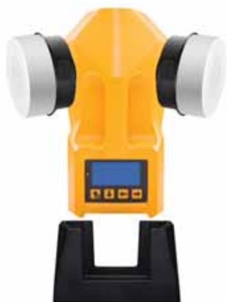
Модель ТРИО БАС ДУО с подставкой из высокопрочного термополимера