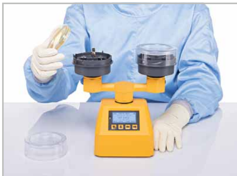
Модель АИРБИО ДУО – легкая работа с чашками Петри.