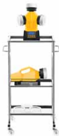
Специальный многоуровневый стэнд. Модель МИНИ