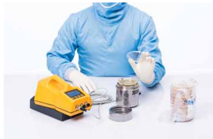
Работа с ТРИО БАС МУЛЬТИСТЕЙШН