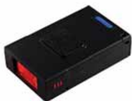
Портативный Считыватель штрих кодов – 1 D и 2D