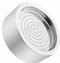
Адаптер из нержавеющей стали для чашек Петри 90 мм.