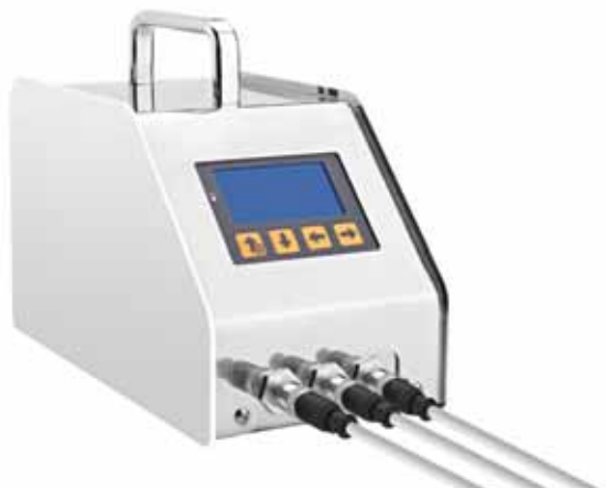
Рис 22 – 3 Корпус ТРИО БАС РАБС ИЗОЛЯТОР