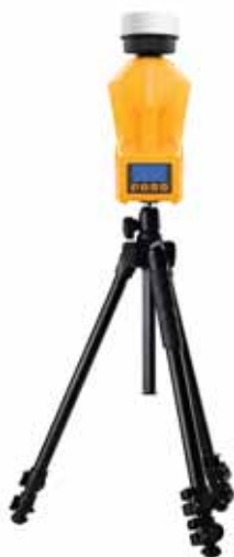
Специальный треножник для размещения всех типов пробоотборников