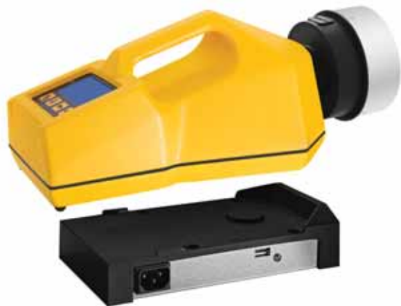
Модель ТРИО БАС МОНО с индукционной подзарядкой

Рекомендуются: для фармацевтических предприятий, чистых комнат, биотехнологических производств и экологических лабораторий.