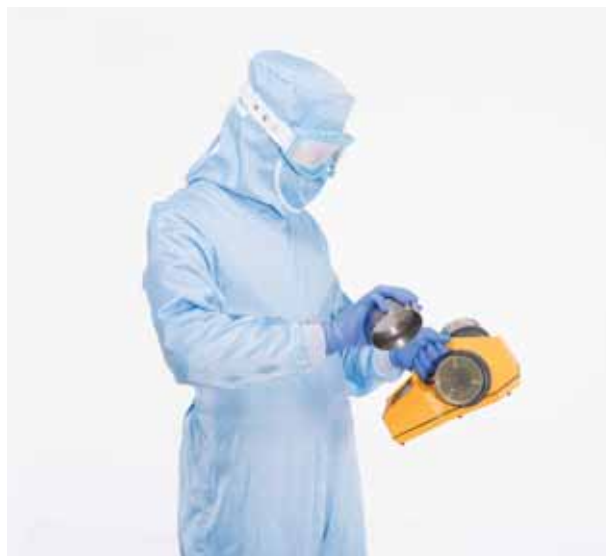
Установка головки на модель ТРИО БАС ДУО