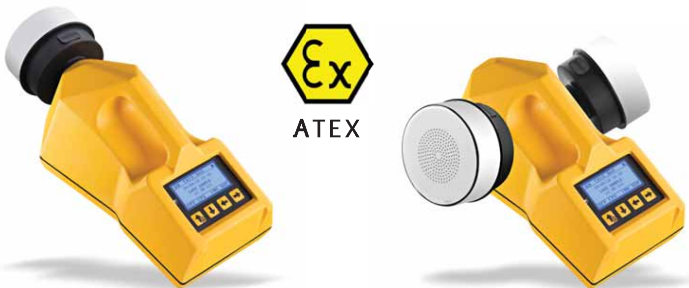
ТАБЛИЦА ДЛЯ ЗАКАЗА: