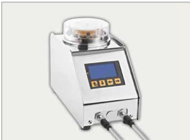
Основной блок МУЛЬТИФЛЕКСА