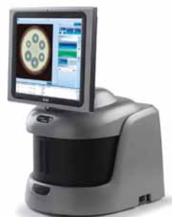
Автоматический счетчик колоний Модель PROTOCOL 3