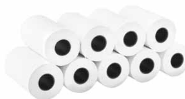
Рулоны специальной бумаги для принтера BLUETOOTH

Документация по квалификации установки и эксплуатации пробоотборников ТРИО.БАС, документация по квалификации рабочих характеристик пробоотборников ТРИО.БАС – заказывается отдельно.