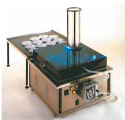
Автоматический дозатор ADMSS для розлива готовой культуральной среды в чашки Петри 90 мм.