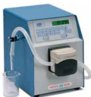
Перистальтический насос PR 2003 для розлива готовой культуральной среды