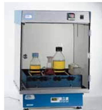
Камера инкубационная VOXCULT на встряхивателе для термостатирования