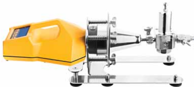
Работа ТРИО БАС МОНО или ТРИО БАС МИНИ с АДАПТЕРОМ ТРИО ГАЗ