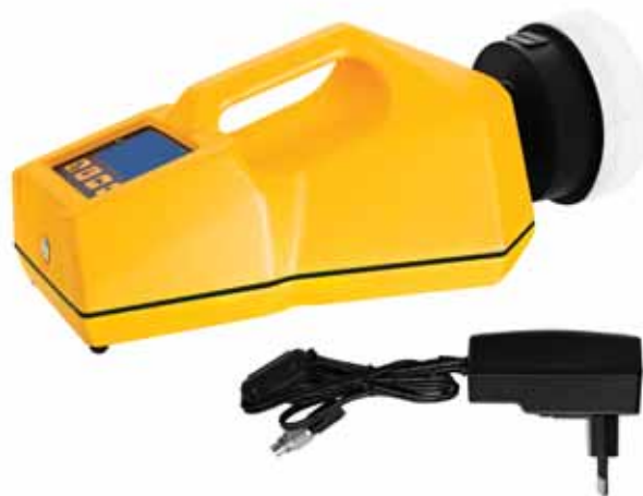
Модель ТРИО БАС МОНО с проводной подзарядкой