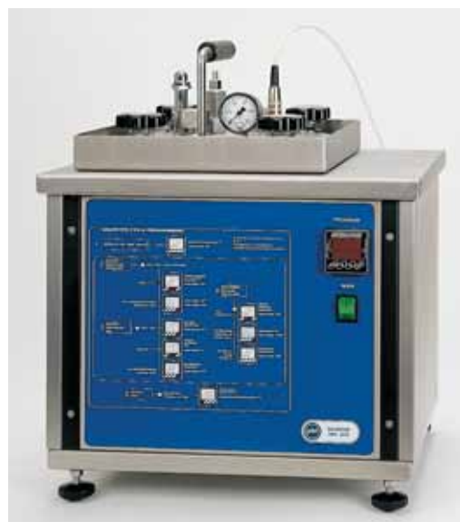
Автоматическая средоварка ECO МИНИ (3 литра)