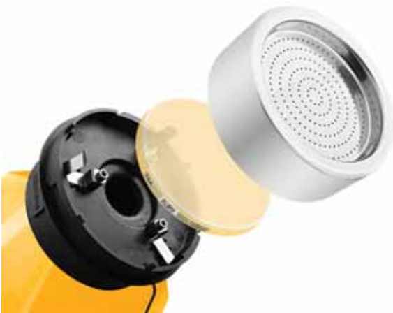
Модель ТРИО БАС МИНИ с адаптером из нержавеющей стали