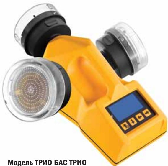
Модель ТРИО БАС ТРИО

Рекомендуется для организаций, которые осуществляют большое количество отбора проб на разные питательные среды или с контрольной чашкой Петри.