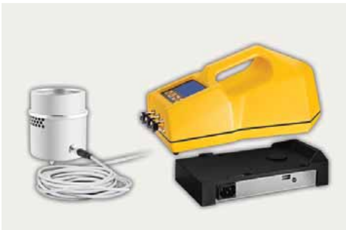
Работа с одним САТЕЛЛИТОМ