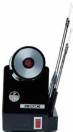
Стерилизатор инфракрасный STERILBIO для микробиологических петель