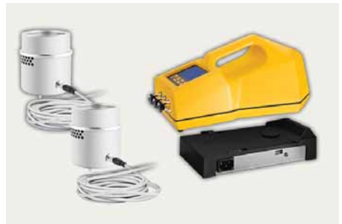
Работа с двумя САТЕЛЛИТАМИ