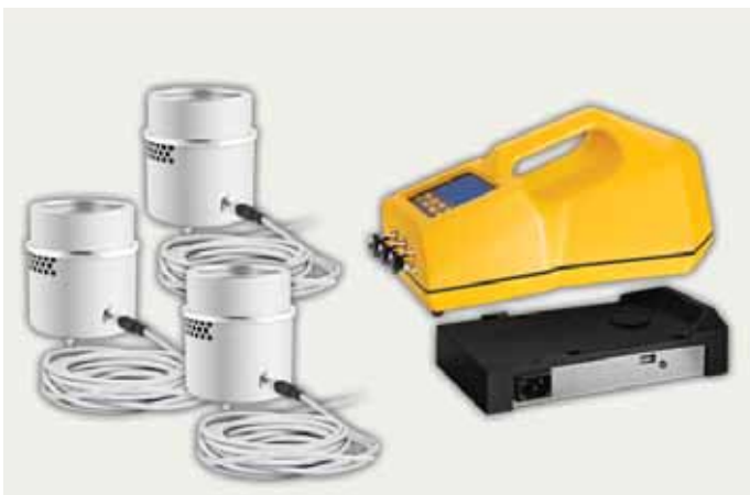
Работа с тремя САТЕЛЛИТАМИ