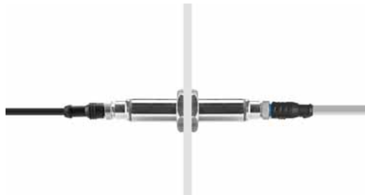
Специальный электрический переходник в стене