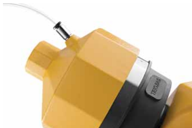
Специальная головка системы КАЛИТЕСТ

Система КАЛИТЕСТ является, независимой системой от системы автокалибровки пробоотборника, для того чтобы проверить точность скорости потока воздуха. Это необходимо для того, чтобы предотвратить возможную недостоверность работы между ежегодными официальными сертификациями контрольными органами.