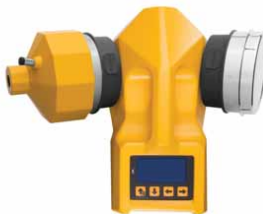
Применение Системы СЕЛФТЕСТ на ТРИО БАС ДУО

Система СЕЛФТЕСТ — это система, которая вместо автоматической калибровки, уже имеющейся в пробоотборнике воздуха, дополнительно проверяет точность скорости воздушного потока.