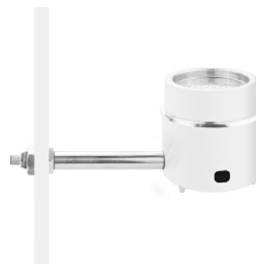
Установка САТЕЛЛИТА на кронштейне

Размеры: 25 x 13 x 18 см. Вес: 3150 грамм. Возможность подключения и управления работой – 3-х Сателлитов.