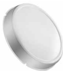
Крышка из нержавеющей стали для адаптера