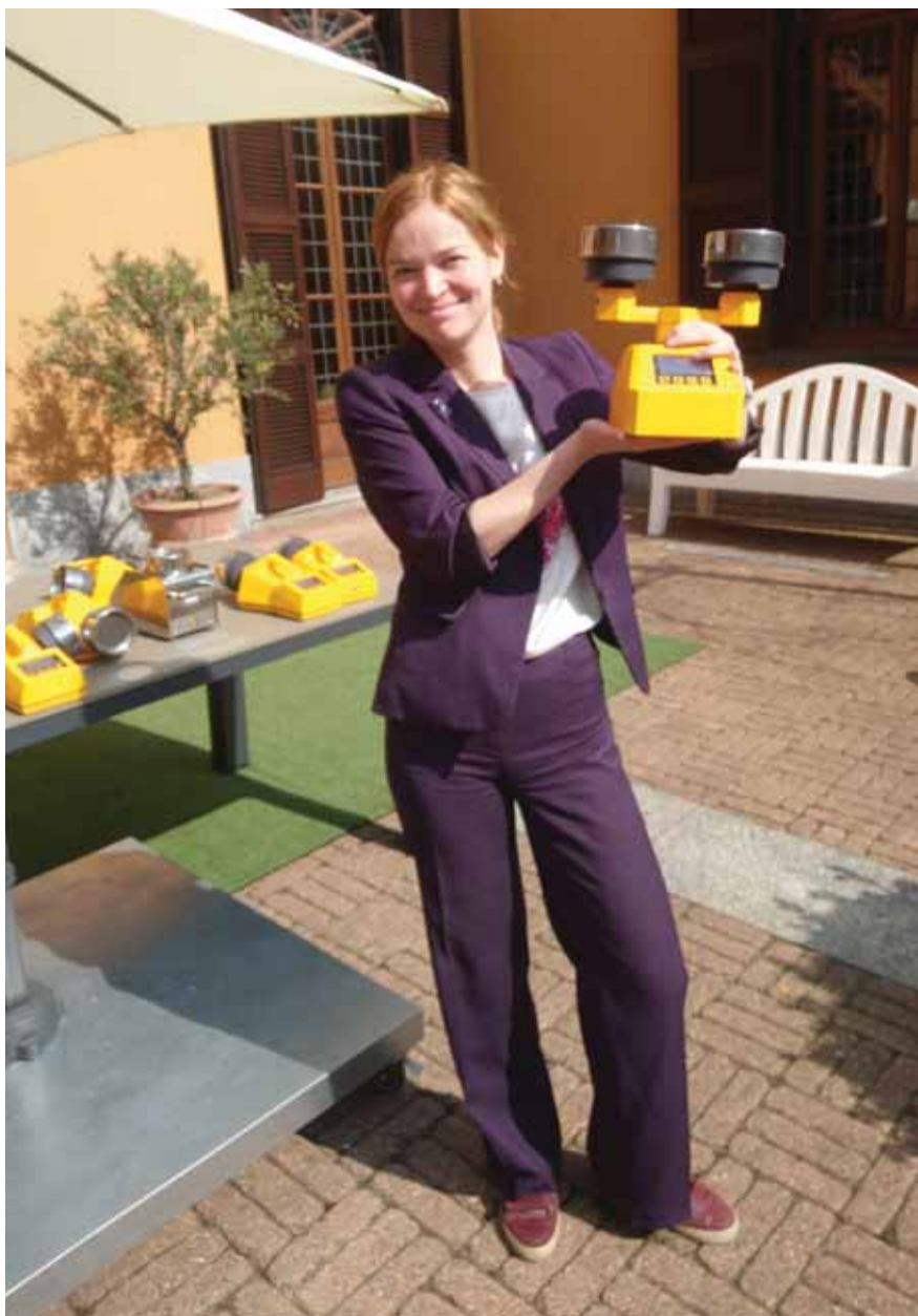
Работа модели АИРБИО ДУО на открытом воздухе