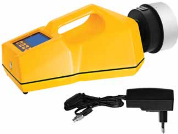
Общий вид моделей

Рекомендуются: для всех предприятий пищевой промышленности и производства косметики. Для тех кто делает небольшое количество отбора проб воздуха и сжатого газа.