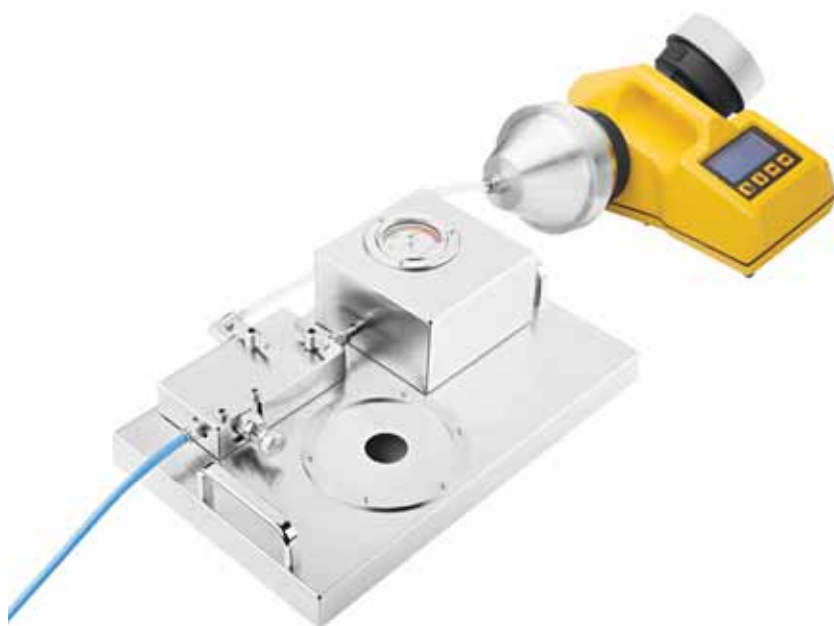
Адаптер ГАЗ-ТЕСТ с ТРИО БАС ДУО Возможно использование с ТРИО БАС МОНО, ТРИО БАС ТРИО, АИРБИО, и САТЕЛЛИТ