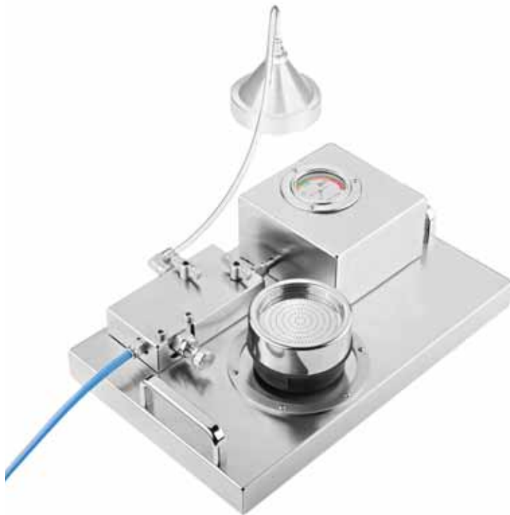
Адаптер ГАЗ-ТЕСТ с Камерой АСПИ ГАЗ-ТЕСТ

БИОЛОГИЧЕСКИЕ ПРОБООТБОРНИКИ ВОЗДУХА – АДАПТЕР ГАЗ-ТЕСТ для отбора проб сжатого воздуха или газа в ЛАБОРАТОРИЯХ, ЦЕХАХ И ЧИСТЫХ КОМНАТАХ.