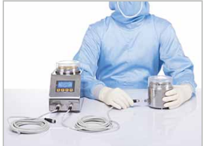
Подключение МУЛЬТИФЛЕКСА к 2 САТЕЛЛИТАМ