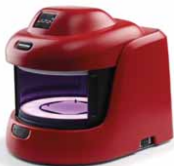
Автоматический счетчик колоний Модель PROTOS