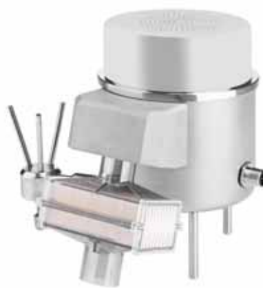
САТЕЛЛИТ на ножках и с фильтром НЕРА