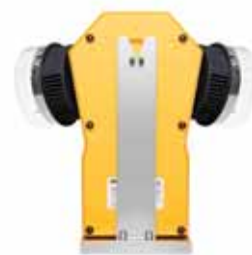
Держатель для вертикального крепления Нержавеющая сталь. Размер: 13 x 10 x 25 см. Вес 300 гр.