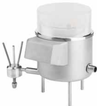
САТЕЛЛИТ на ножках