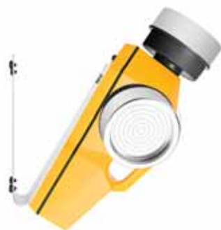
Держатель для установки на стене Нержавеющая сталь. Размер: 21 x 13 x 16 см. Вес 700 гр.