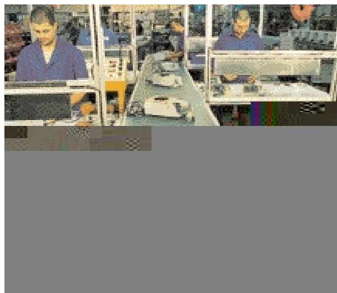
Линия сборки разных моделей сухих термостатов.

7001475 блок на 6 микропланшетов с 96 лунками на 1,2 мл. Вместимость - 1 планшет.